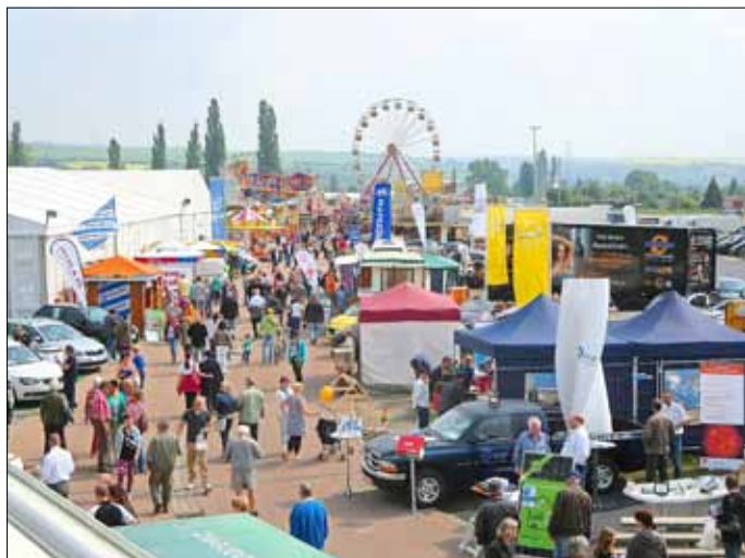
Aussteller der „Reforma“ erhalten Bonus bei Aufträgen!

Neben den vielen Annehmlichkeiten und Vorteilen, die man als Aussteller bei der „Reforma“ genießt, gilt es in erster Linie Neuheiten vorzustellen und Verträge abzuschließen.