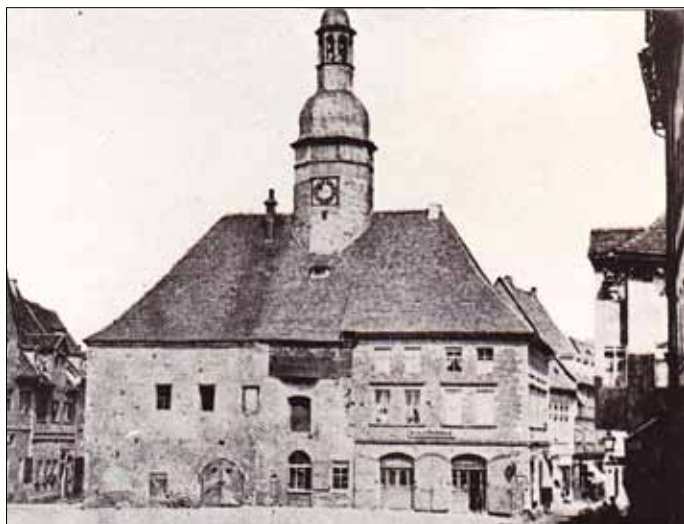
Ursprünglicher Standort auf der alten Waage vor dem Abbruch des Gebäudes

Wir erzählen u. a. die Geschichte der Turmuhr der St. Andreas-kirche