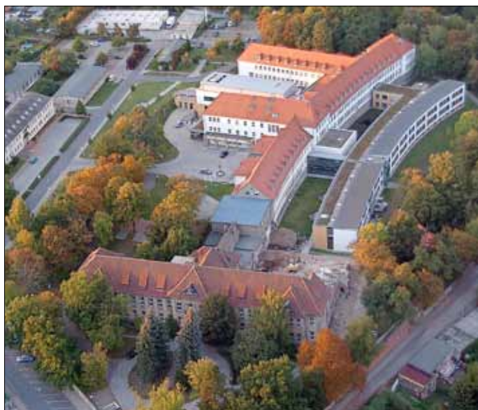
Helios Klinik im Jahr 2009